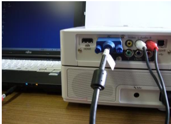
プロジェクターとパソコン